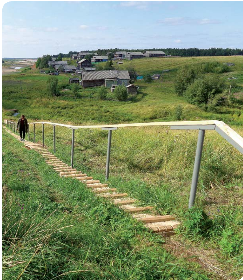
На снимках: новый спуск к реке в деревне Березник; фестиваль традиционных северных культур в поселке Каменка; благоустройство аллеи районного Дома культуры в Мезени.

Большой популярностью у жителей и гостей Мезени пользуется