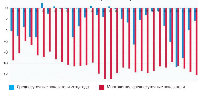
Ход среднесуточной температуры воздуха за декабрь 2019 г. по г. Архангельску