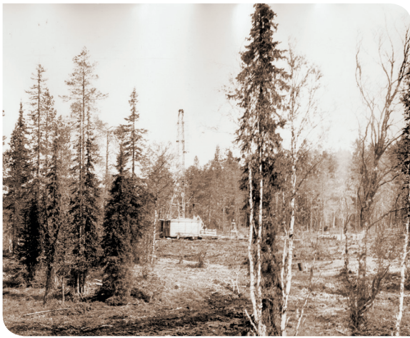
Работы Юрасской геологоразведочной экспедиции на территории будущего месторождения алмазов им. М. В. Ломоносова. 1979 год.

Никто не работал в щадящем режиме. За короткий срок был создан крепкий коллектив геологов, буровиков, геофизиков, обогатителей, транспортников. Помимо вышена-