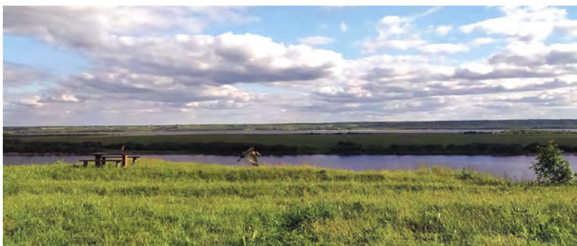
Вид с дачного участка Ирины Ниловой