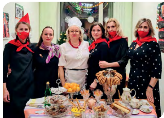
«Советское» управление по работе с персоналом