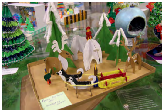
«Новогодняя мечта», Анастасия Рубан, 10 лет