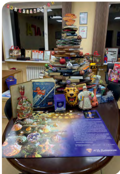
Предновогодье в отделе пресс-службы

заняло управление транспортного оборудования, сотрудники которого собрали 12 елочек! Дизайн каждой связан с ГОКом им. В. Гриба, а самая оригинальная – вообще подвешена к потолку и напоминает алмазный карьер.