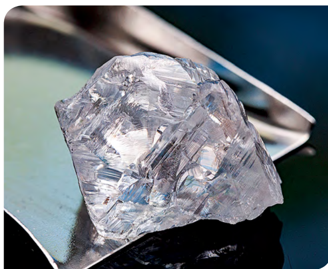
Алмаз массой 70,51 ct

Инновационные технологии при обогащении кимберлитов позволяют АО «АГД ДАЙМОНДС» регулярно добывать алмазы высокого качества. Весенние великаны стали 38-м и 39-м по счету среди уникальных особо крупных алмазов, добытых на месторождении им. В. Гриба с начала промышленной отработки.