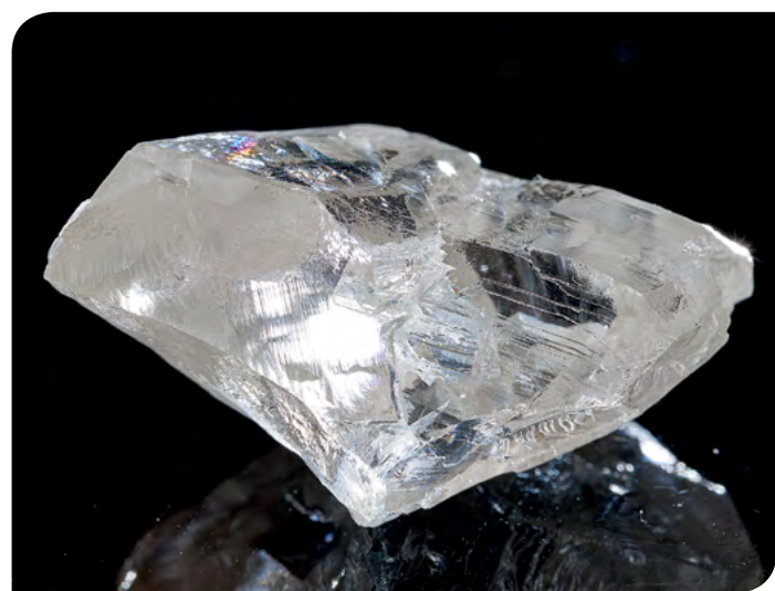
Алмаз массой 81,58 ct